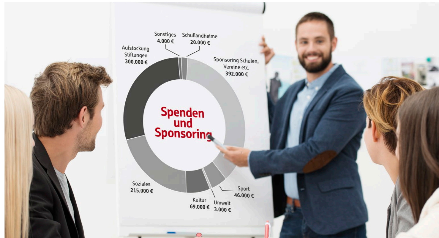
Insgesamt: 1.049.000 Euro + drei Stiftungen mit einem Kapital von 6.628.000 Euro

Seit jeher ist der Nachhaltigkeitsgedanke Teil der Sparkassen-DNA. Wir fördern nicht nur die wirtschaftliche, sondern auch die sozial und ökologisch zukunftsfähige Entwicklung der Region. Beginnend am eigenen Arbeitsplatz, den wir Jahr für Jahr ressourcensparender gestalten. Dasselbe gilt vor unserer Haustür: Auch 2019 sind wieder mehr als 1.000.000 Euro an Vereine und in gemeinnützige Projekte geflossen.