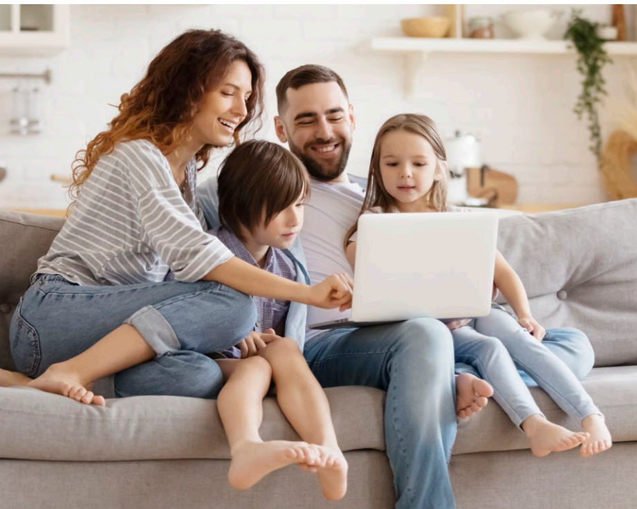
Auch von zuhause aus lassen sich viele Bankgeschäfte bequem erledigen.